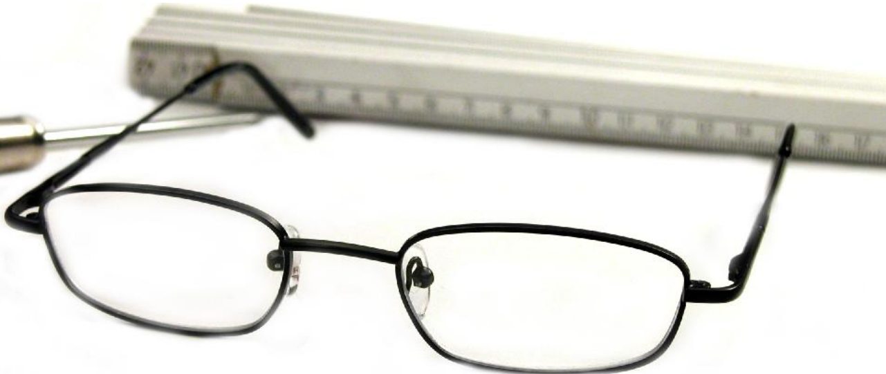
Grafik 2: Materialanalyse Bügel Modell 202-22-01P

Primetta stellt durch ständige Qualitätskontrollen und durch Prüfungen bei unabhängigen Testinstituten sicher, dass alle gesetzlichen Anforderungen erfüllt werden.